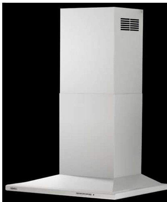
Coloris unique: Inox